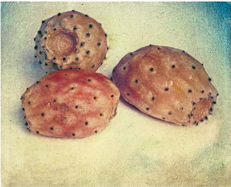
SENZILLES Al fotògraf llucmajorer li agradaven especialment les coses més senzilles. A dalt i a la dreta, la polaroid transportada Figues de moro (1999) i un dels cossios de sa mare, Cossiol, núm 10 (1985).