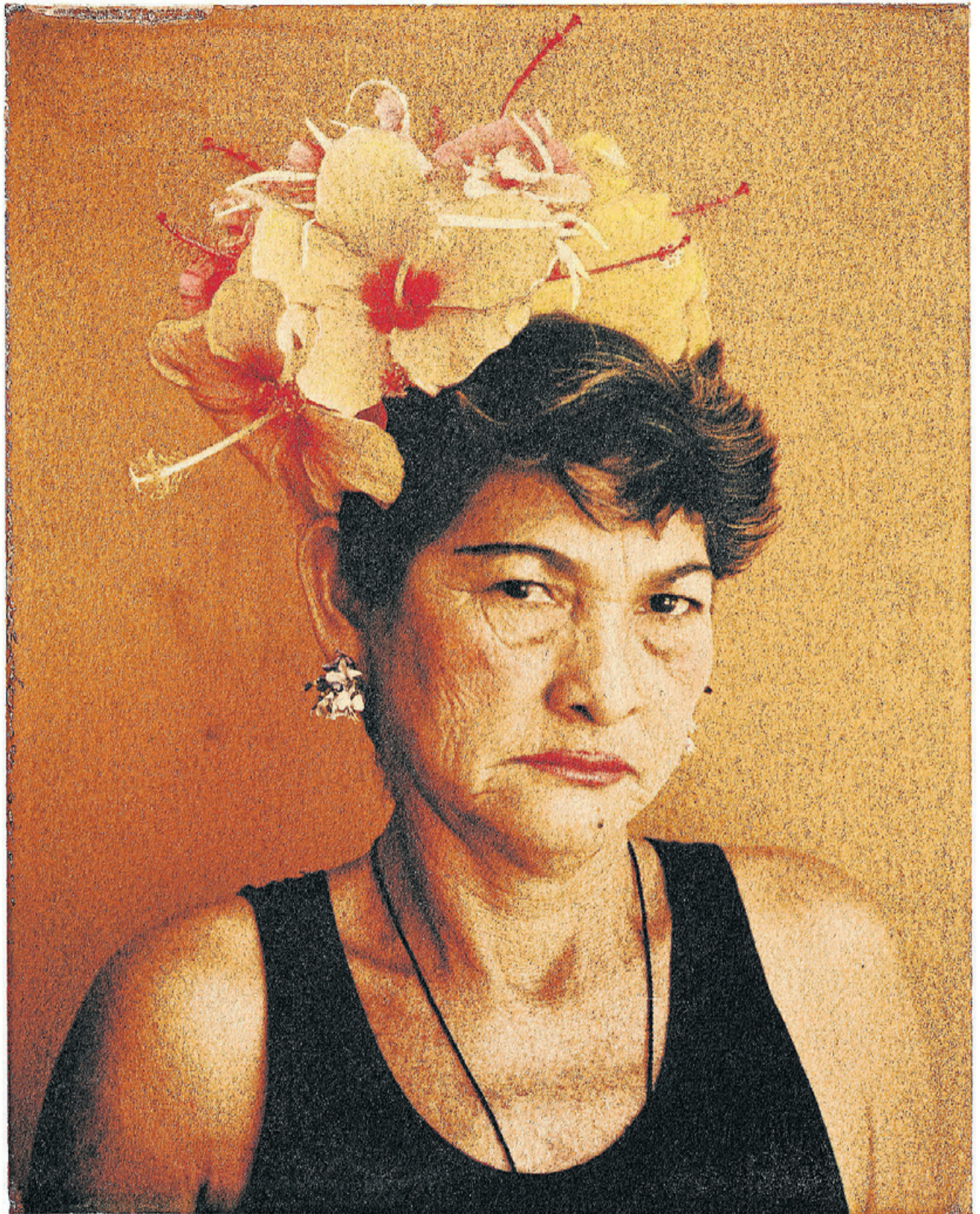
RETRATS TROBATS Quan viatjava, Catany no preparava les fotografies. A Isla Margarita va gaudir retratant les dones tal com anaven endiumenjades, guarnides amb flors. La foto titulada Margaritenya , del 1996, és una polaroid transportada.

Toni, famejant de fotografiar-lo, em va demanar que obtingués el seu permís, i el noi, en veure's protagonista de la sessió, se'n va avergonyir i, incrèdulament, es va posar a riure entre carn i pell. En Toni li va exigir, però, que no rigués, que es mantingués seriós, que era el gran rei d'Etiòpia... «Ja tinc el Jamjam del Tirant, no era sinó ell qui jo esperava», va exclamar triomfant. Com va dir sant Jeroni: no voler ser perfecte és un delictes».