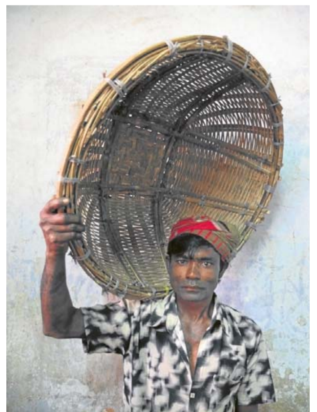
Els joves d'un mercat de Bangla Desh cridaren l'atenció del fotògraf llucmajorer, que els va retratar en un viatge fet l'any 2011. TONI CATANY