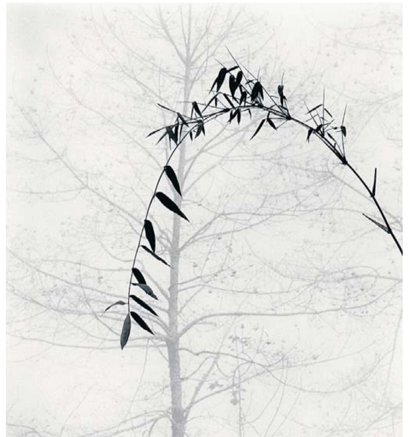
Michael Kenna. Bambú i arbre, poble de Qingkou, Yunnan, Xina, 2013 .

Iniciatives Per al CIF es preveu una diversitat d'activitats al voltant de la fotografia