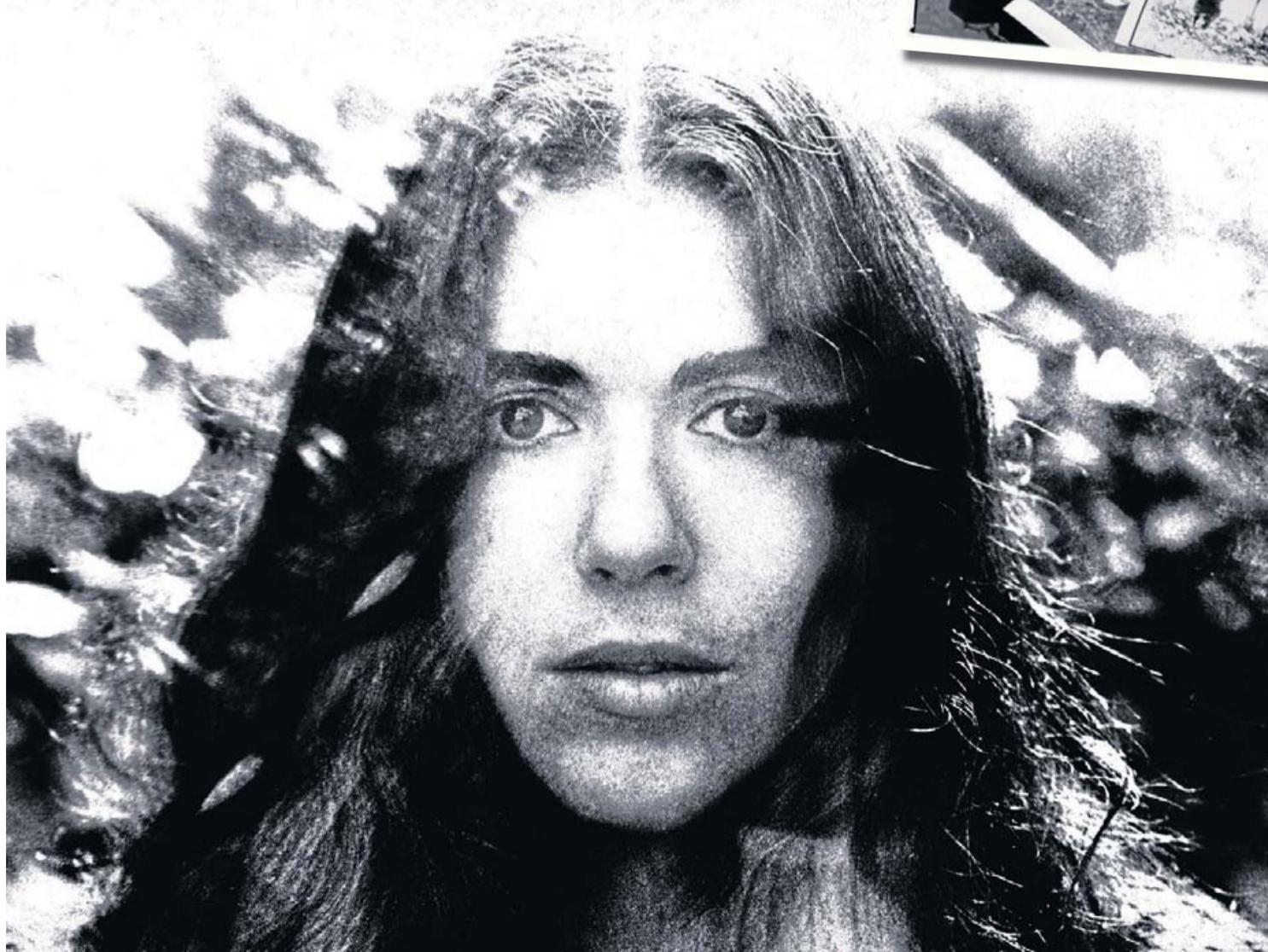
Maria del Mar Bonet retratada per Toni Catany el 1968, una foto que il·lustra el cartell de l'actual exposició a Lluçmajor.