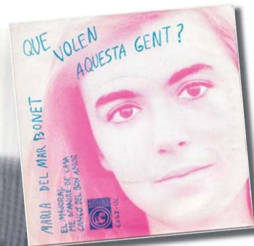
Portada del disc Què volen aquesta gent? (1968), censurat pel franquisme.